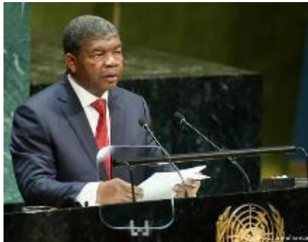
João Lourenço Presidente de Angola Nações Unidas, Junho 2021

Estabelecer pilares de boa governação , concentrando-se sobre anti-corrupção e diversificação da economia