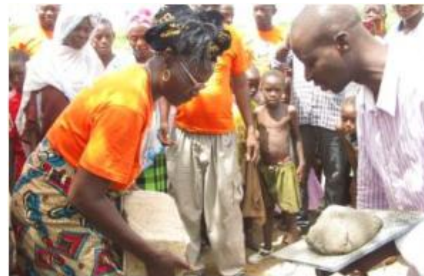
Presidenta da ACDB colocando a 1ª pedra da CFH