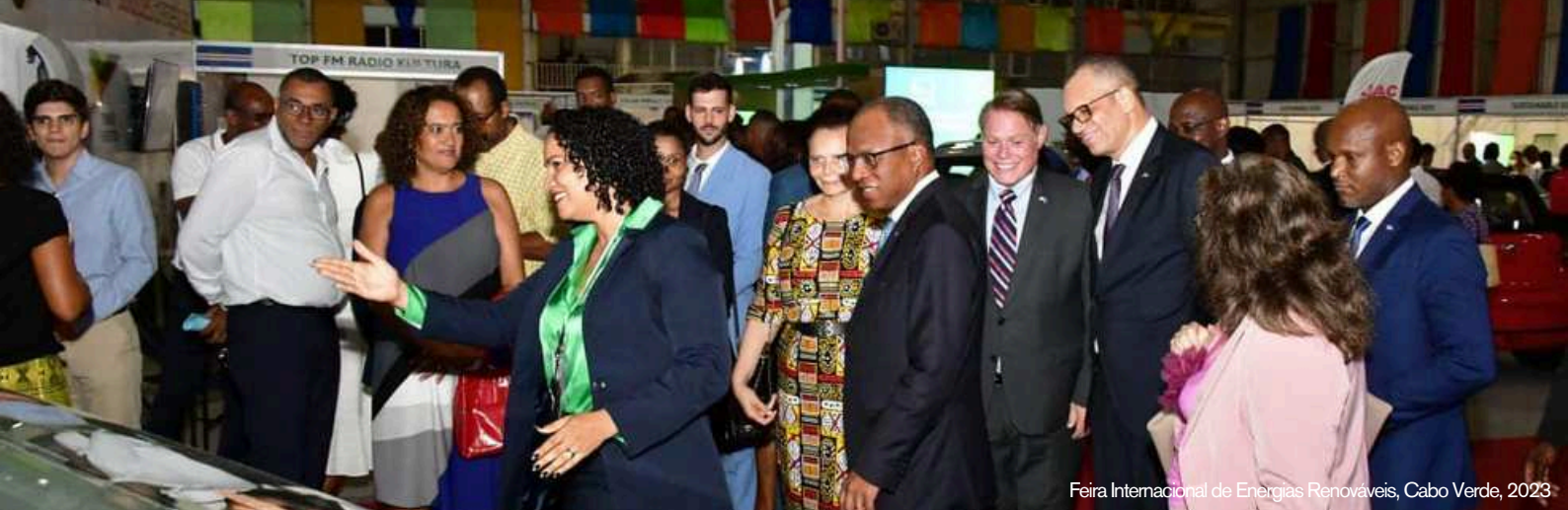
Feira Internacional de Energias Renováveis, Cabo Verde, 2023